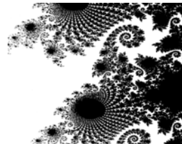
フラクタル—マンデルブロ集合の例